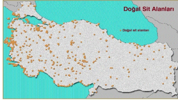
Şekil 1. Doğal Sit Alanları, Türkiye'deki Önemli Biyolojik Çeşitlilik Alanlarını Nispeten İyi Bir Şekilde Kapsamakta (Yeşil Atlas Dergisi, 2003).